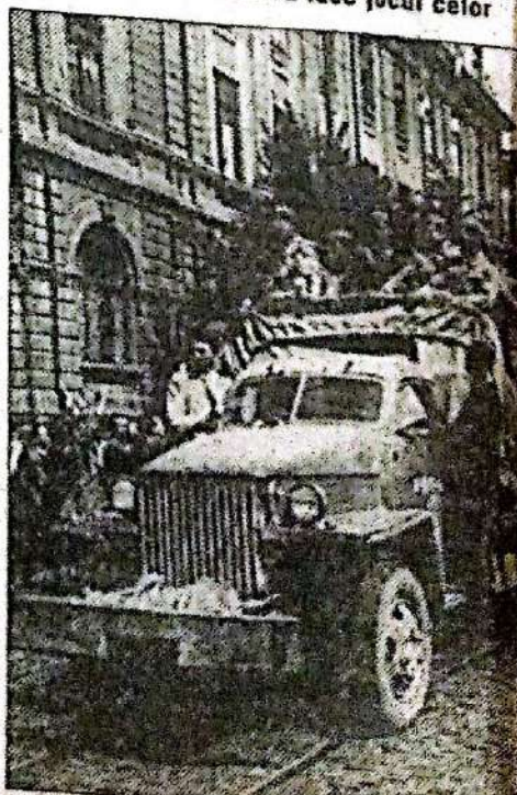
Intrarea "Tudor Vladimirescu"

DI L. Pătrășcanu, ministru de Stat: Acum reviu la elementul politic. Jocul primejdios de până acum trebuie să înceteze. Dacă se merge cu iluzia - mă adresez partidelor politice - că România va face jocul celor