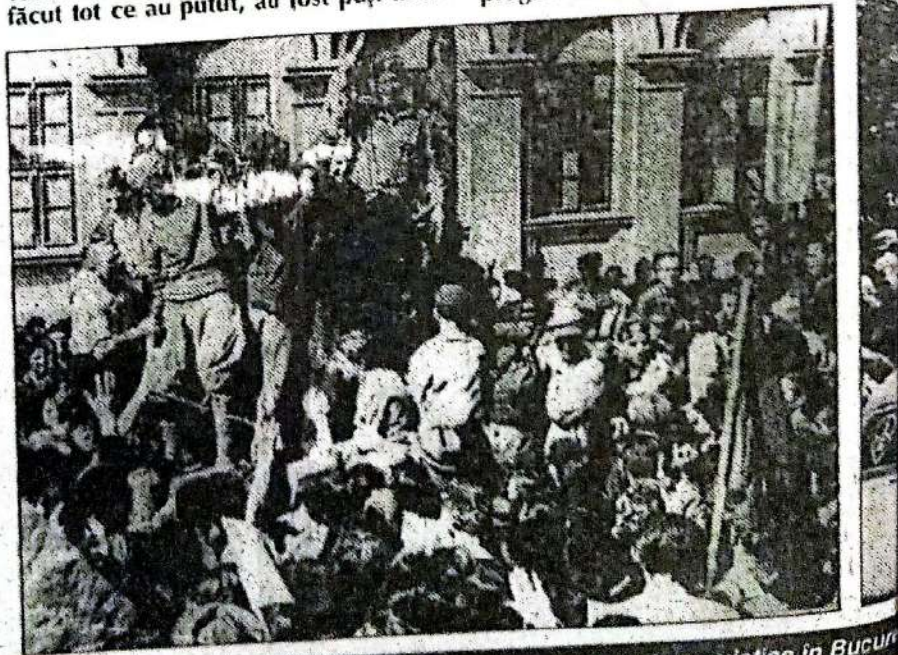
Intrarea trupelor sovietice in Bucuru

Un singur lucru, mi-am luat libertatea de a exprima mulțumiri dlor care au luat parte la pregătirea acestor lucruri. Dar