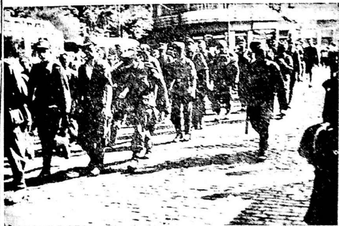
Lagărul de prizonieri pentru cotorpitorii infranși