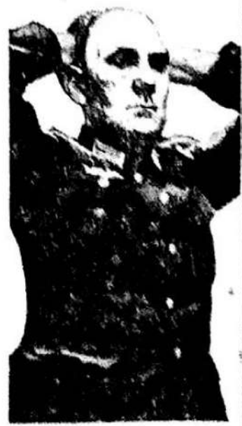
Ofițer hitlerist în două ipostaze: trufia începutului și urzila sfârșitului