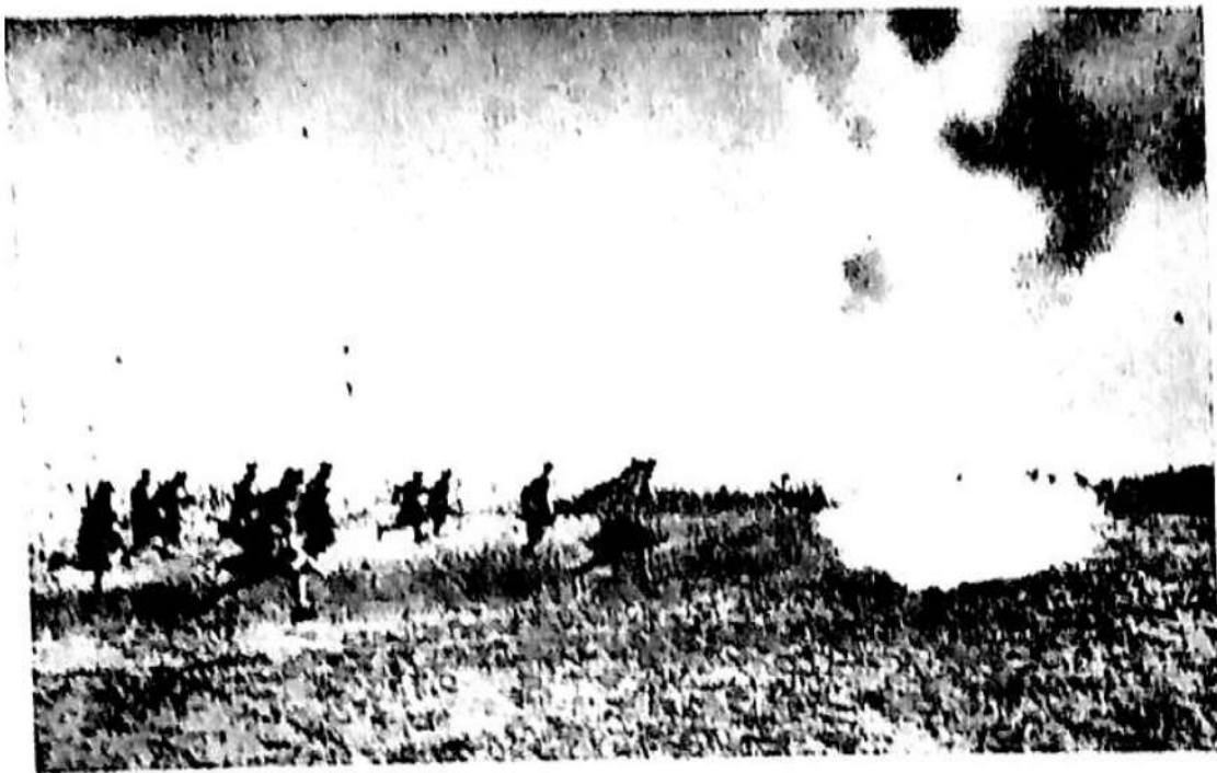
Nu un front, ci puzderie. Păunțutul romănesc trebuia curățat metru cu metru

tă patriotice de la uzinola „Malaxa” și fabrica de pline „Gagel” lichidează rezistența Misiunii militare germane pentru armata aerului.