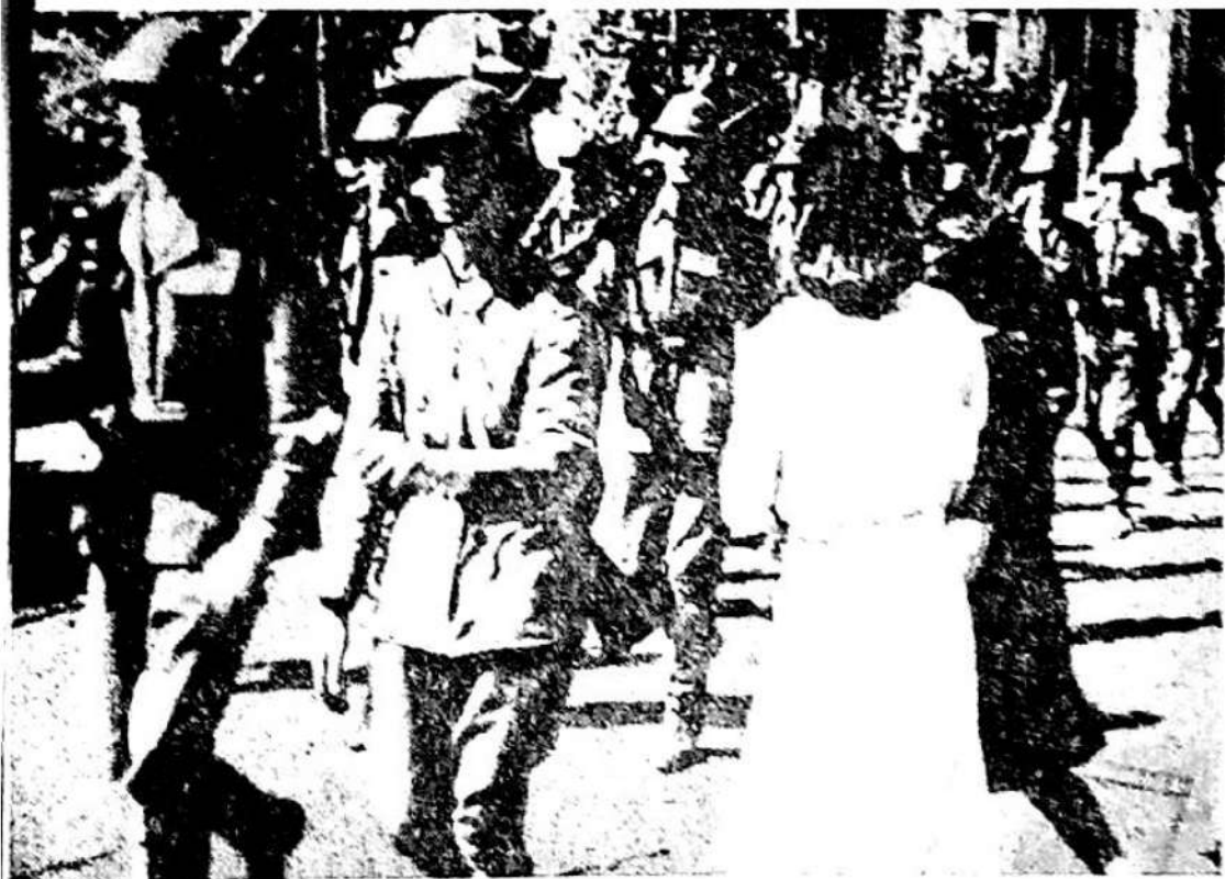
Florile recunoștinței pentru victorioșii apărători ai patriei