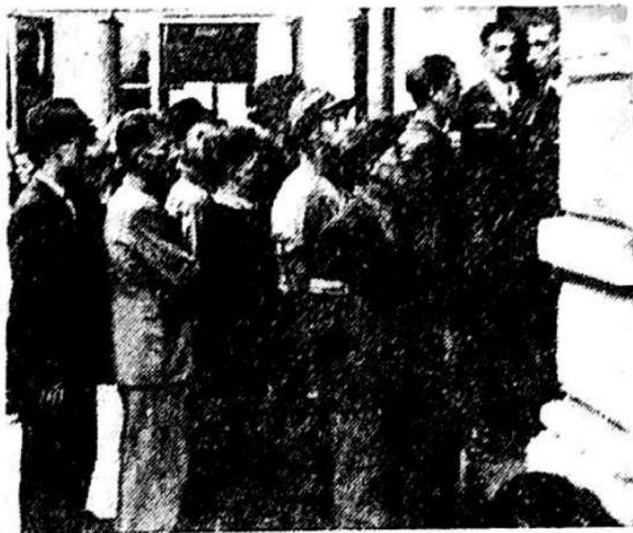
Octombrie 1944. „Vrem să plecăm voluntari pe frontul antihitlerist!”

— În zona de acțiune a Armatei 1 române (Podișul Transilvaniei și Banat), eforturile vizează apărarea împotriva unor pătrunderi inamice din exterior.